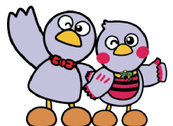
埼玉県のマスコット 「コバトン」&「さいたまっち」

埼玉県在宅ワーク就業支援事業では、在宅ワーク初心者から経験者まで幅広い女性を対象に、様々なセミナーやイベントを開催し、就業につながるようサポートします。