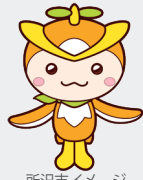
所沢市イメージキャラクター「トコロん」

(埼玉県所沢市寿町27-7 コンセルトワー所沢2階) 西武新宿・西武池袋線「所沢駅」から徒歩10分