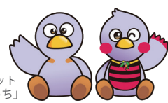
埼玉県のマスコット「コバトン」&「さいたまっち」